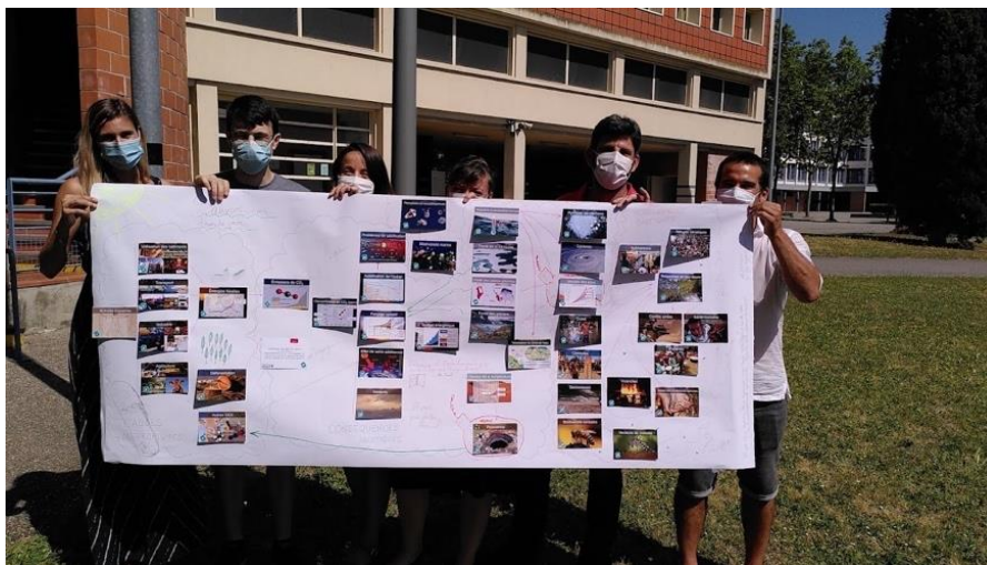
Figure 1 : Rendu final d'une Fresque du Climat.

La « Fresque du Climat » est un jeu sérieux développé par Cédric RINGENBACH ([4]), à l'occasion d'un enseignement sur le changement climatique dispensé à l'ISAE-Supaéro. En 2018, ce spécialiste de la transition énergétique a créé une association portant le nom de ce jeu, dans le but de sensibiliser le plus grand nombre de personnes aux enjeux du changement climatique. Cette sensibilisation prend la forme d'ateliers de trois heures, par groupes de quatre à huit joueurs, au cours desquels 42 cartes, représentant des activités humaines, des phénomènes physiques ou des impacts sociologiques, sont disposées sur une feuille de 2 m 2 .