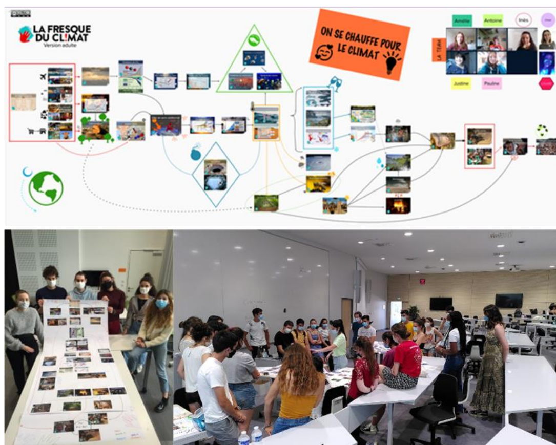
Figure 2 : La Rentrée Climat dans les différentes composantes de Toulouse-INP

L'association de la « Fresque du Climat » a lancé, en 2019, le projet « Rentrée Climat » ([5]), qui vise à faire participer tous les étudiants du supérieur à un atelier. Pour organiser cet événement, les universités et écoles du supérieur ont le choix entre faire à appel à l'association et l'organiser avec leurs propres forces. Toulouse INP a choisi cette dernière option ([6]) et forme donc ses propres animateurs à l'aide de formations régulières. À ce jour, ce sont près de 200 animateurs, principalement des étudiants, qui ont été formés dans les différentes composantes.