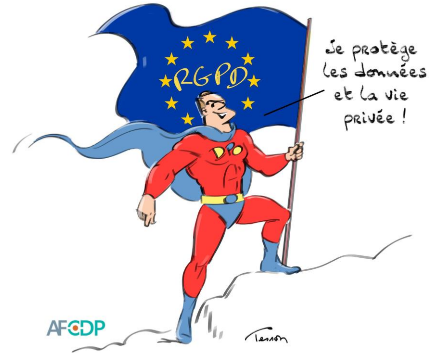
Le DPO à l'honneur